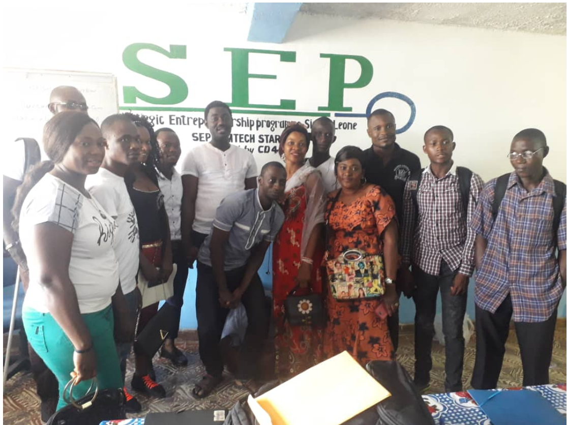
Foto 1 van SEP Start Hub IAMTECH