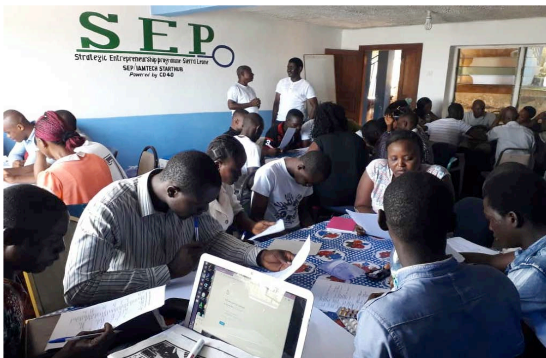
Groepswork tijdens het traject