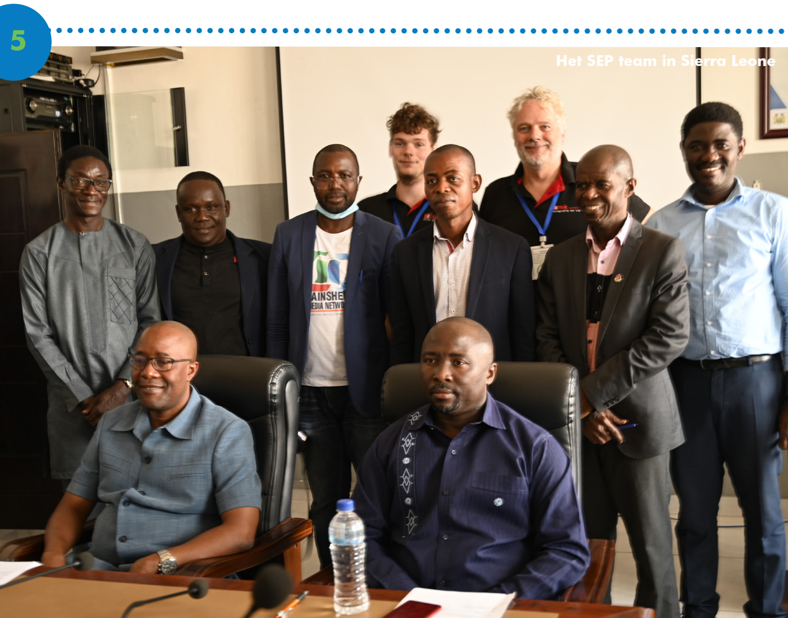
Het SEP team in Sierra Leone