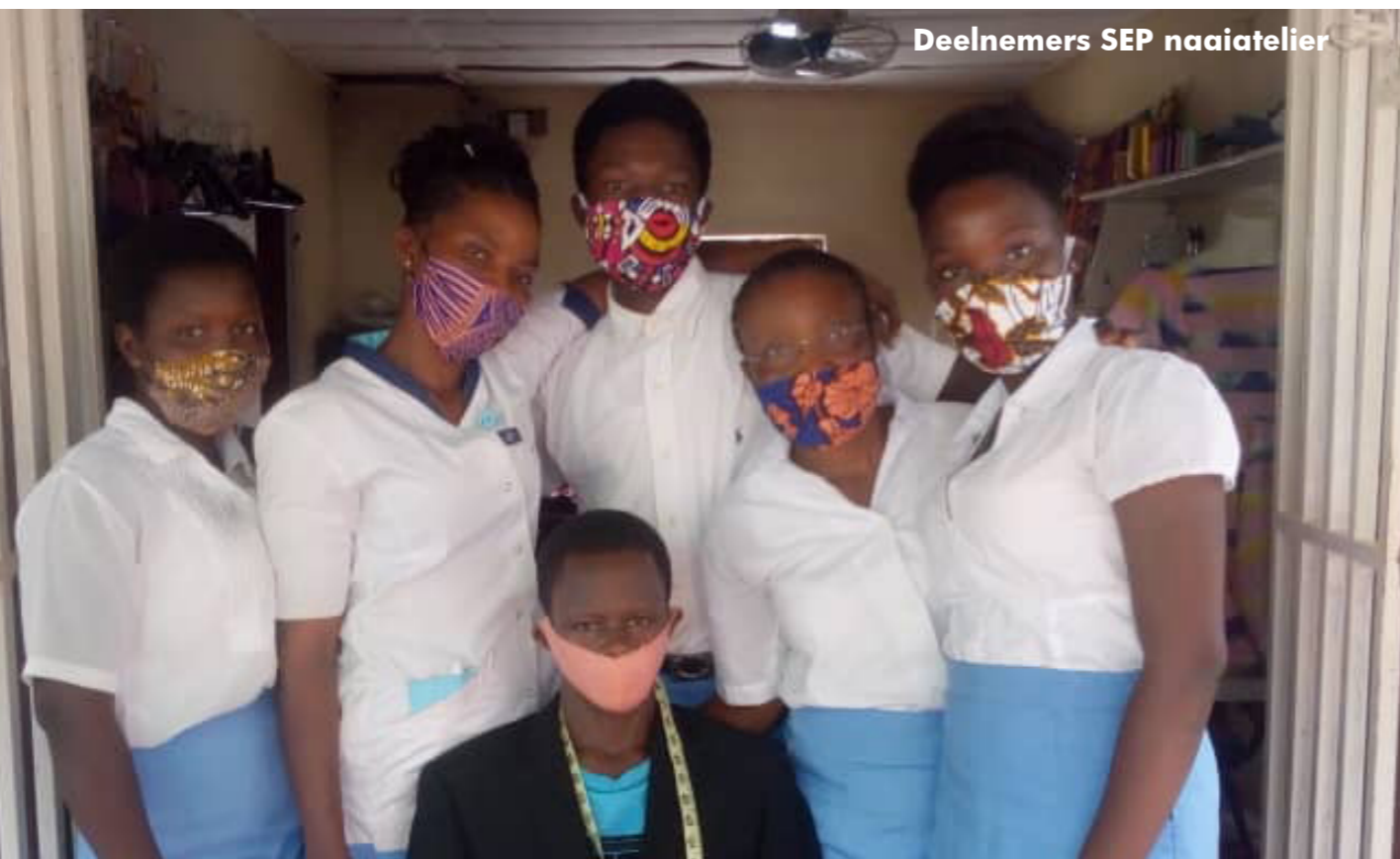
Deelnemers SEP naaiatelier