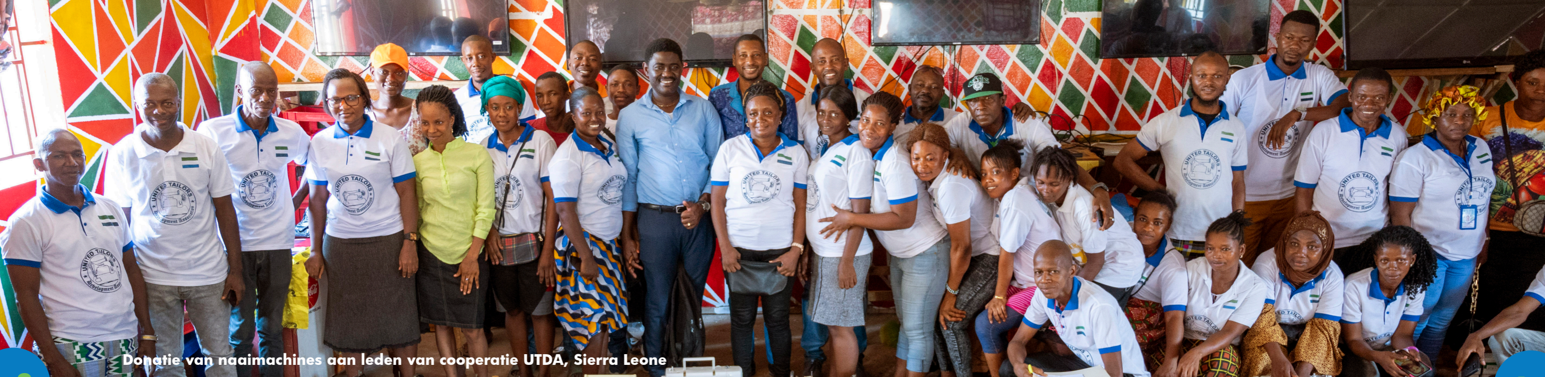
Donatie van naaimachines aan leden van cooperatie UTDA, Sierra Leone