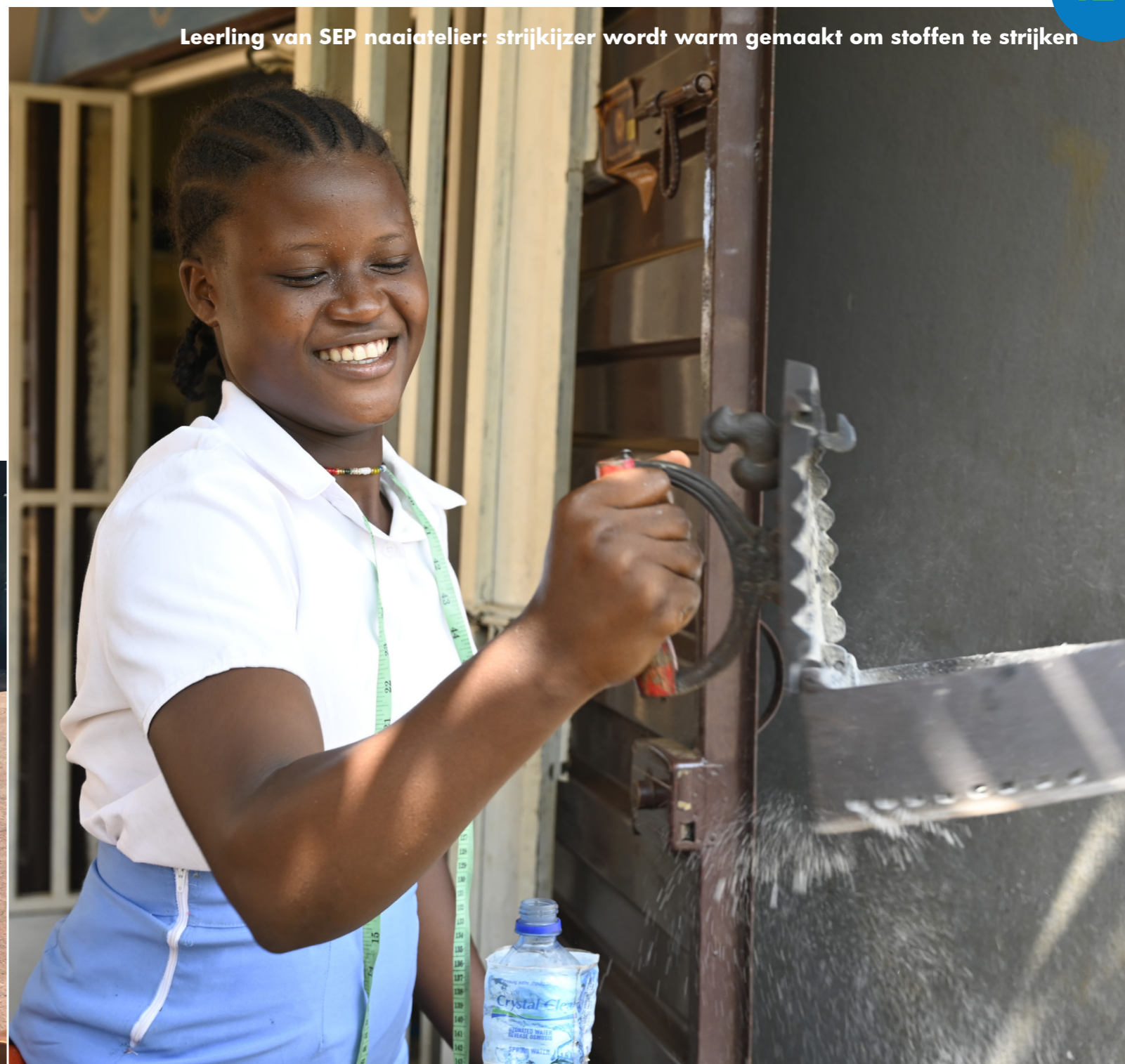
Leerling van SEP naaiatelier: strijkijzer wordt warm gemaakt om stoffen te strijken